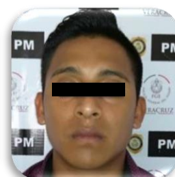
ALBERTO "N" P.P. 194/2018 Cotaxtla