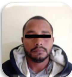
ZEFERINO "N" P.P. 49/2017 Cuitláhuac