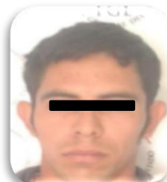
ELEUTERIO "N" P.P. 48/2015 Coatepec