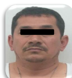
MARCO "N" P.P. 204/2018 Minatitlán