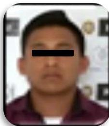
ALBERTO "N" P.P. 194/2018 Boca del Río