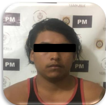
PEDRO "N" C.P. 126/2018 Tantoyuca