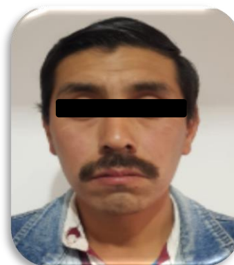
VÍCTOR "N" P.P. 59/2018 Huatusco