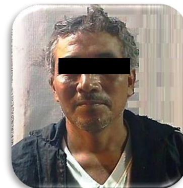
JUAN "N" P.P. 272/2018 San Rafael