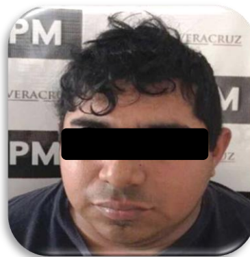
RUFINO "N" P.P. 140/2017 Xalapa