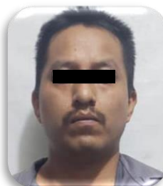
MARGARITO "N" P.P. 164/2016 Córdoba